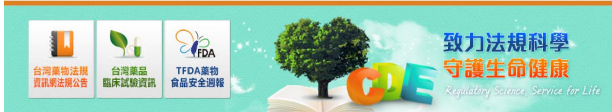
表一、健康食品安全性分類原則及評估項目